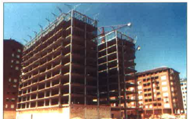
Edificios realizados con vigas "T".