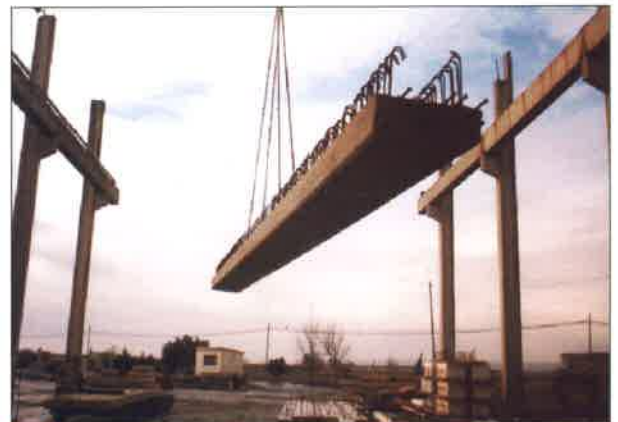
Elevación con grúa de vigas "T".

La semi-viga se suministra con la armadura de momentos negativos, que se coloca en obra. Dichas armaduras están formadas por un conjunto de redondos de longitudes variables según solicitaciones de proyecto, y colocados en la parte superior de la viga y coincidiendo con el pilar de apoyo, de esta manera se consigue, además de la absorción de momentos negativos, un gran monolitismo en el nudo.