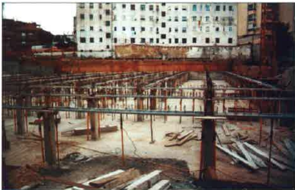
Colocación de vigas "T".

Los hormigones son fabricados en planta automática, controlando las dosificaciones por medio de equipos informáticos, tomando además probetas diariamente de todas las fabricaciones, cuyos resultados están a disposición de los técnicos que intervienen en el proyecto.