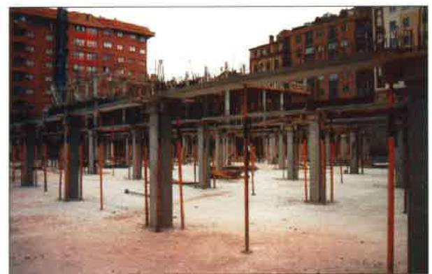
Collarines y apuntalamiento de vigas "T".