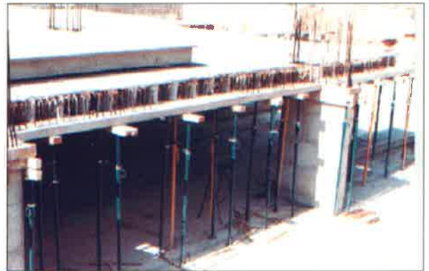
Vigas "T" con forjado.