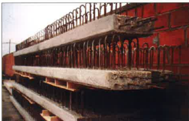
Almacenamiento de vigas.