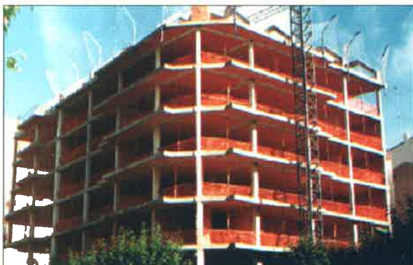
Techo con vigas "T" planas.